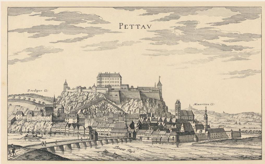
Abbildung Vorderseite: Wappen der Grafen von Herberstein (StLA, Landschaftliche Wappenmatrik) Abbildung Rückseite: Pettau/Ptuj um 1680 (StLA, Ortsbildersammlung)