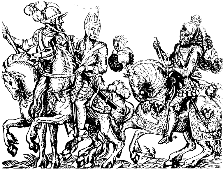
Abb. 1: Georg Thury, 1568 bis 1571 Kommandant von Kanischa, mit Lazarus von Schwendi (links) und Kaiser Maximilian II. Unter Thury wurde ein Großteil der Festungsmauern Kanischas errichtet. (Budapest, Ungar. Nationalmuseum.)

den wir von hie (Wien) nit sicher an die Neustatt dürffen, 3 nichts mehr vorhanden. Wohl im Zusammenhang mit dem Rückgang der Türkengefahr nach dem Frieden von Karlowitz (1699) aber auch aus Angst vor Verschwörungen ungarischer Magnaten ließ Kaiser Leopold I. im Jahr 1702/03 die bis dahin in einem Sumpfbiet etwas außerhalb der Stadt Kanischa gelegene Festung schleifen. Schon 1323 hatte ein Vorgängerbau bestanden, der als Besitz der Familie Kanizsai galt. 1568 übergab Ursula Kanizsai, Witwe des Palatin Thomas Nádasdy, die Wehranlage an die Hofkammer und erhielt im Tauschweg dafür die Orte Borsmonostor und Csejte. 4